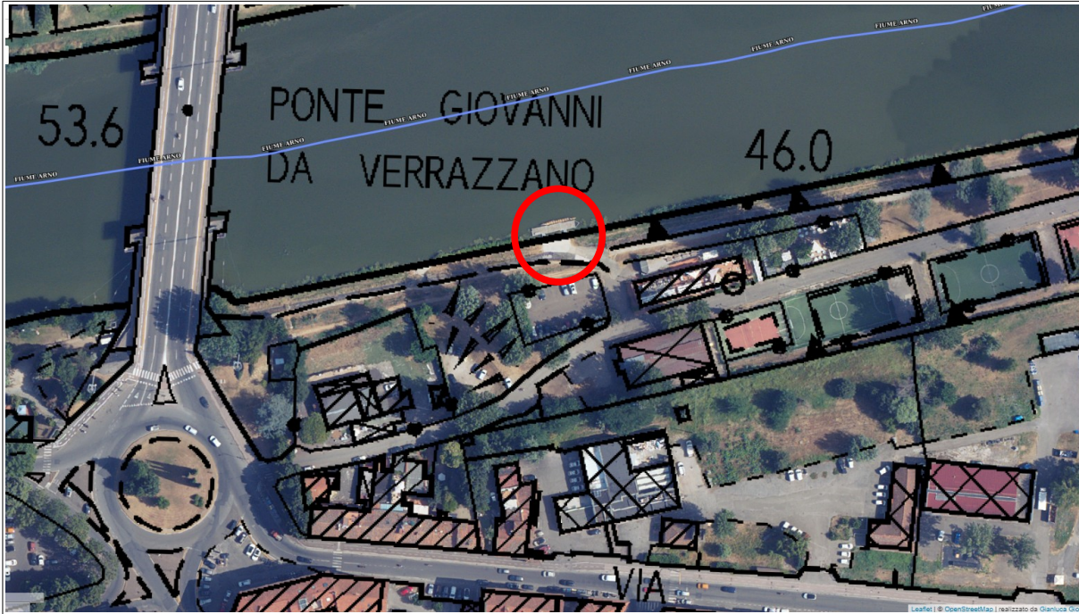
[Immagini di mero inquadramento territoriale]