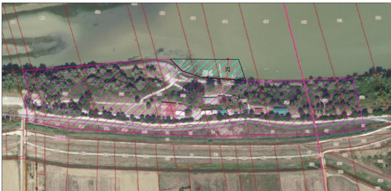
Catastale sovrapposto ad ortofoto

DESCRIZIONE BENE DEMANIALE: area del Demanio Idrico posta all'interno della Cassa di espansione Piaggioni - Roffia in Loc. Roffia nel Comune di San Miniato, nello stato di fatto in cui si trova, censita al Foglio di mappa 1 (particelle 517, 518, 519, 520, 521, 522, 523, 524, 525, 526, 166, 65, 68, 500,501, 502, 503, 72, 75, 76, 186, 77, 79, 8) e al Foglio di mappa 2 (particelle 750, 650, 36, 37), per una superficie complessiva del terreno di mq. 54.260 e una superficie lacustre di mq 2129, così come meglio identificata nell'elaborato grafico catastale ed ortofoto di cui sotto (vedi cartografia)