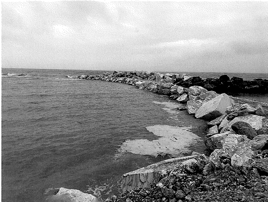
Foto n.1 Pista di servizio prima della mareggiata 23-25 gennaio 2021