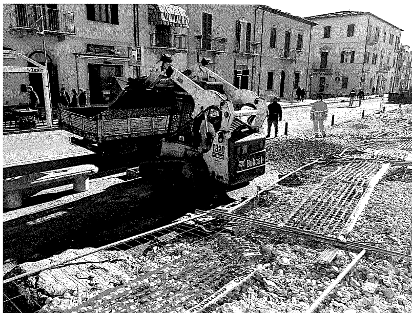
Foto n.6-7 Avvio operazioni di rimozione materiale lapideo 26 gennaio 2021

SOMES Srl Via della Sapienza, 20 Villa di Briano (CE) P. IVA 02013080306