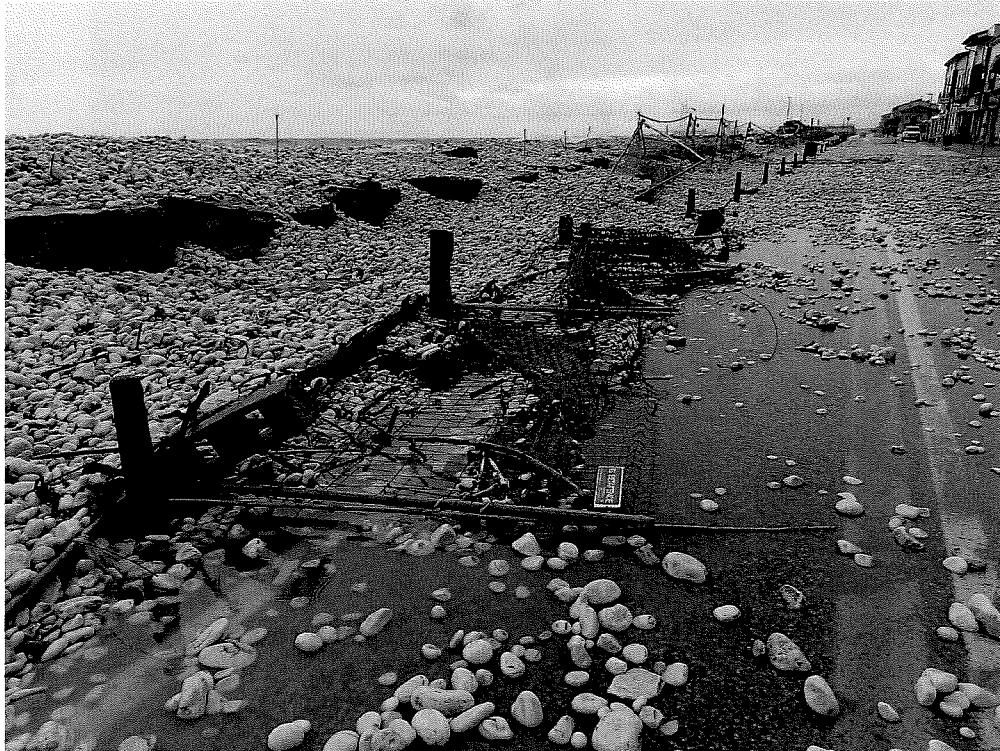
Foto n.4 Recinzione di cantiere in corrispondenza delle scogliere radenti mareggiata 23-25 gennaio 2021