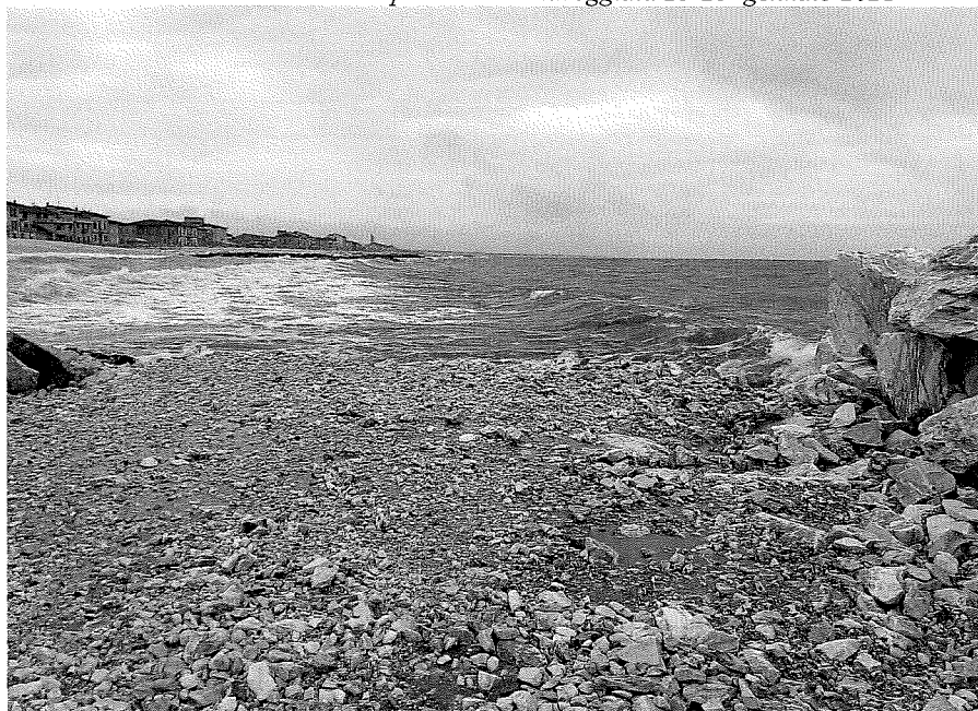
Foto n.2 Particolare pista di servizio prima della mareggiata 23-25 gennaio 2021

SOMES Srl Via della Sapienza, 27 Villa di Briano (CE) P. IVA / C.F. 08083840619