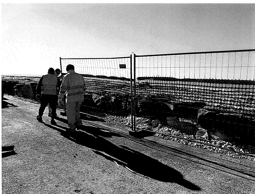
Foto n.8-9 Avvio operazioni di ripristino recinzione lungo la strada litoranea 26 gennaio 2014

SONIES Srl Via della Sapienza, 27 Villaggio di Briano (CE) P. IVA / S.N. 08043840619