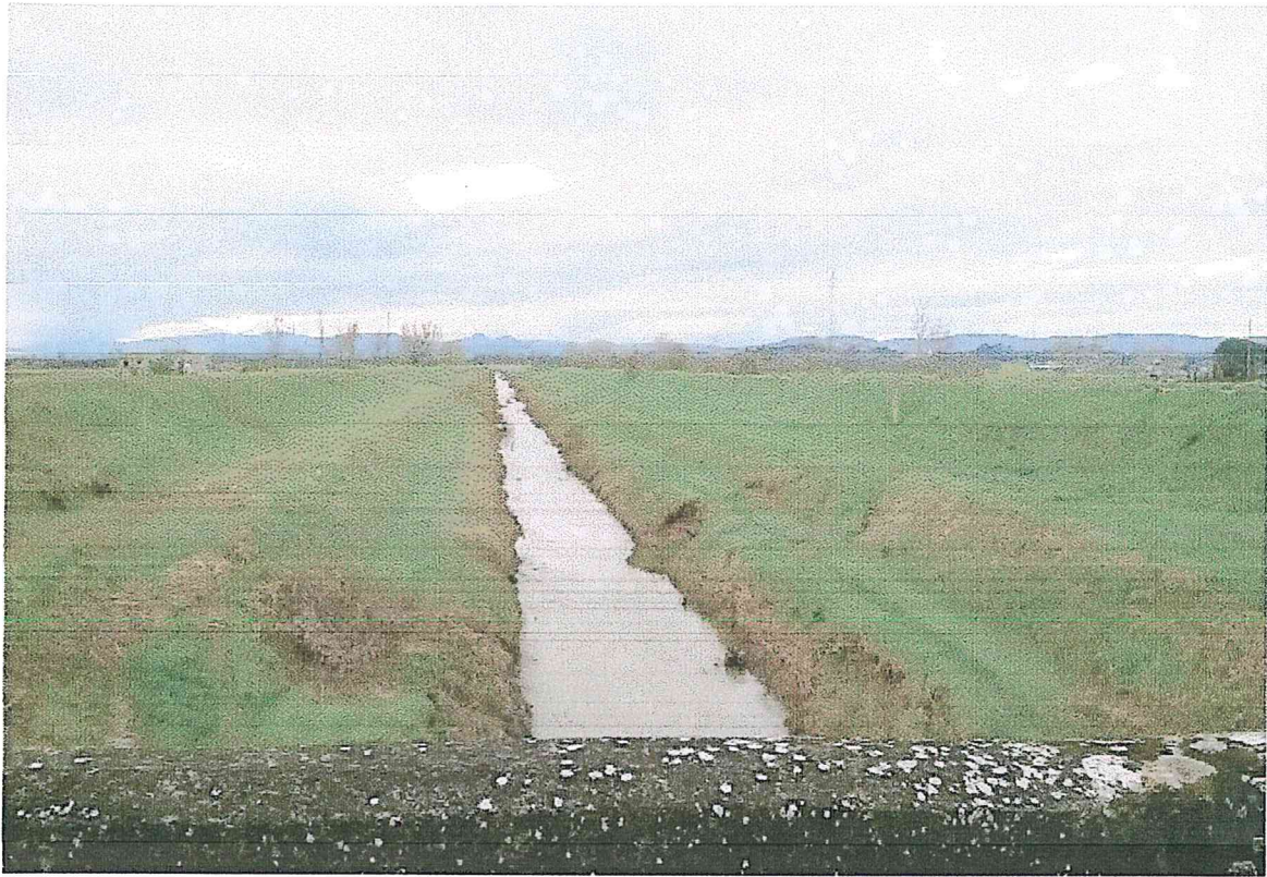
ALLACCIANTE DI SINISTRA