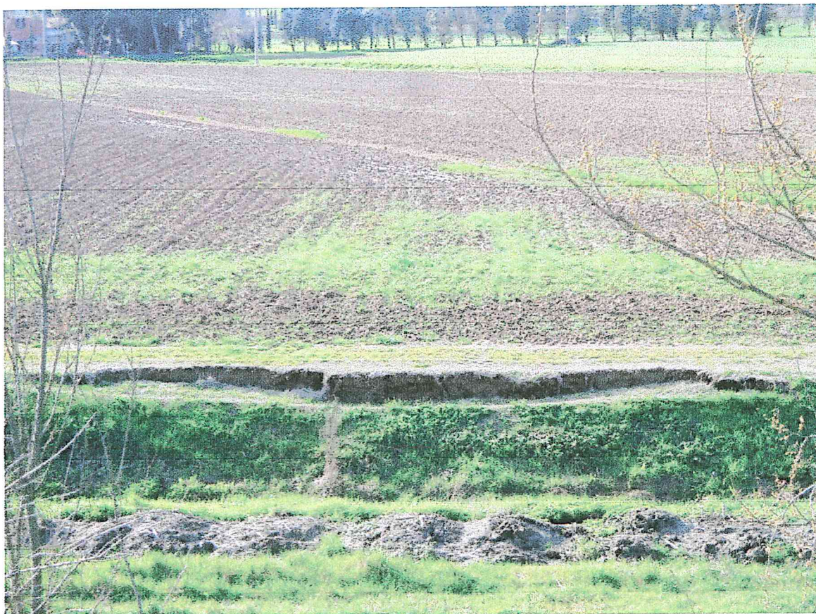
FOSSETTA DEL TERCHIO